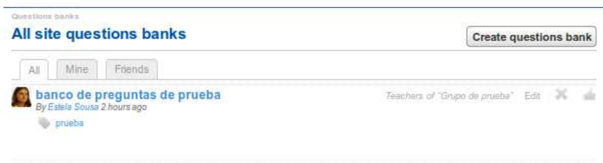
Figura 8: Listado de Bancos de Preguntas.